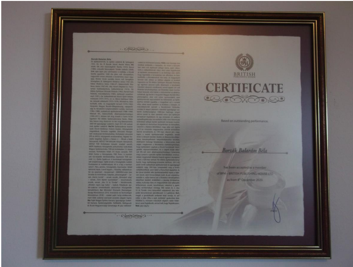
Főlvétel a „Magyarország sikeres személyiségei” enciklopédiába 2021-ben és 2023-ban