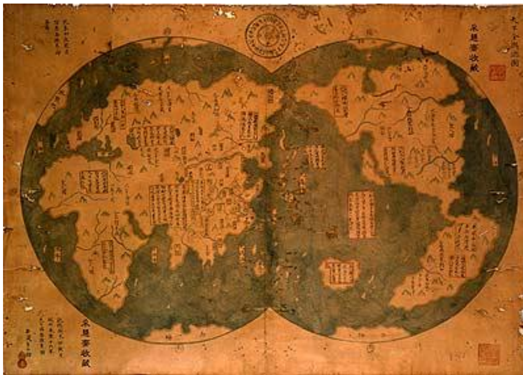
Kolumbusz előtti Kínai világtérkép

Időszámításunk előtt úgy 10 ezer évvel, Ázsiában három nagy civilizáció alakult ki és jutott a társadalmi, tudományos és kulturális fejlettség kimagasló szintjére. (Hasonlóan magas szintet értek el Egyiptomban, vagy Dél-Amerikában az azték és az inka kultúrák, de azok jász vonatkozásai nagy bizonyossággal kizárhatók.) Legtöbb tekintetben napjainkra sem emelkedett magasabb szintre; sem államszervezet, sem a vallásosság, bölcsélet, politika, orvoslás, csillagászat, stb. terén a modern ember.