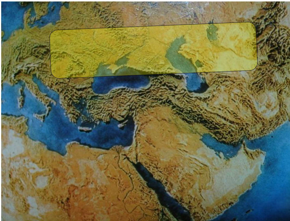
Borzák Balarám Béla

Élettér a 40. és az 50. szélességi fokok között, 0 és 150 m tengerszint feletti magasságban, azonos éghajlati-, földrajzi- és vízrajzi adottságok között, füves, ligetes -vizenyős- legelő területeken, meg nem telepedve.