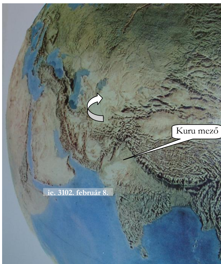
A jászok őseinek kóborrá válása (kóbor = aki állandóan jár, mint a pásztor, legelőt keres)

A Kuru mezei csatában sok százezer harcos vonult fel, azonos időben, azonos helyen, számtalan népből, nemzetségből, a két hadra kelt fél oldalán. Abban az időben olyan magas fokon bírták és gyakorolták a szellemi tevékenységeket -különösen a tátosok, de- a képzett vezetők is, hogy tudtak gondolati úton érintkezni száz kilométeres távolságokról is egymással. (a legképzettebb vezető harcosok, gondolati úton képesek voltak akár láncreakció megindítására, vagy akaratuk szerint, annak visszavonására. Tudtak nukleáris csapás szerű, harci cselekményeket kiváltani. Ilyen személy volt pl.: a Kuru mezei csatában harcoló felek közül a Pándavák egyik vezetője, Ardzsuna. Hasonlóan fejlett vezető harcos volt az ellenfél Kauravák egyik főembere, Durjodana, de ő csak elindítani volt képes láncreakciót, annak vissza-vonására már nem.)