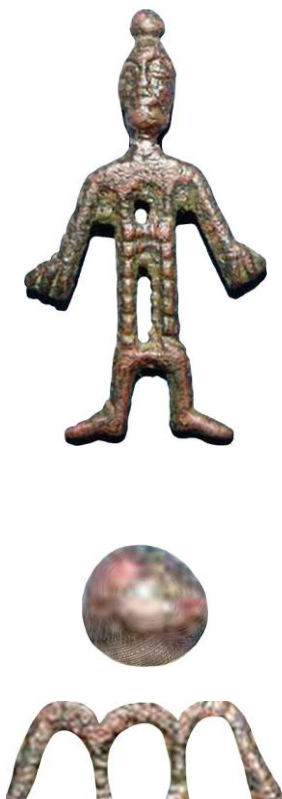
1. ábra. Alán amulett a Lyukó országa mondattal, fején a napistent jelképező Lyukó hieroglifa, törzsén az "ország" jelentésű hármashalom

A szobor alakú írásemlékek megdöbbentően szokatlanok tűnhetnek azok számára, akik a latin alapú írásunkhoz hasonló írást várnának a hun sztyeppéről is. Ezek az eltérések a végső soron kőkori eredetű ősírástól, amelyeket tankönyv jelleggel leírtam a Magyar hieroglif írás c. kötetben. Ez az írás a vallásos nézetek illusztrálására született meg, éppen arra találták ki, amit ez esetben is látunk.