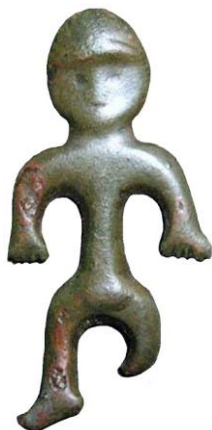
1/b. ábra. A jóságos Lyukó Istent ábrázoló alán amulett, az ágyék táján kidomborodó Lyukó jel az élet forrását jelképezi.

Ezért aztán okunk van annak feltételezésére, hogy ha az alak egyik testrészét feláldozták az olvashatóság kedvéért (a láb helyére jelet tettek), akkor a többi testrész is lehet elolvasható.