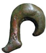
2. ábra. A szobor lába a kacsakarigó alakú jó hieroglifa