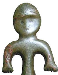
6. ábra. Az amulett Isten hieroglifája megdöbbentő telitalálat, az Isten szó nem csak elolvasható, hanem az alakja meg is jelenik előttünk.