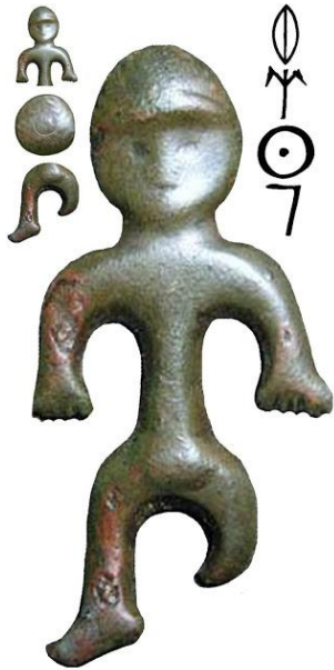
1/a. ábra. A jóságos Lyukó isten amulett (középen), az amulett szójelei (balra fent) és a párhuzamos székelő betűk

A jelen cikksorozatban bemutatott alán amulettek között kivételes jelentőségű az e cikkben tárgyalt példány, mert a lábait szemlélő számára kétségtelemmé válhat, hogy az alán szobrocscsa szójelekből van összeállítva.